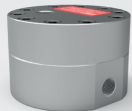
Zahnrad-Durchflussmesser (ZHM KL Serie)