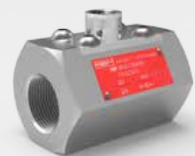
Turbinen-Durchflussmesser (HM P Serie)