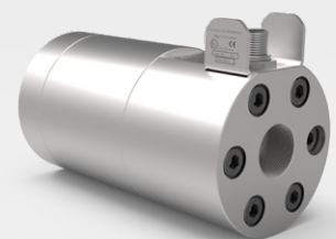
KEM Spindel-Durchflussmesser (SRZ Serie)