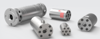
KEM Spindel Durchflussmesser (SRZ Serie)